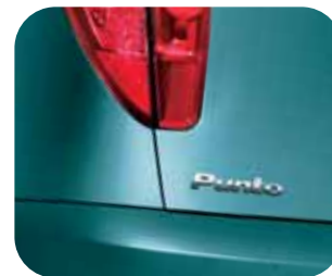
291 Tyrkysová Doo Wop