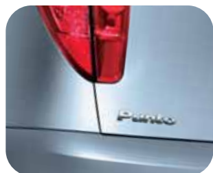
792 Azúrová Surf