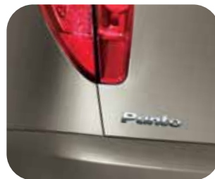
690 Sivá Digital