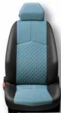
119 Textil modrá