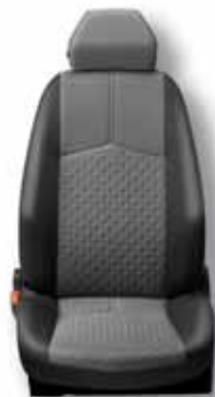
111 Textil sivá