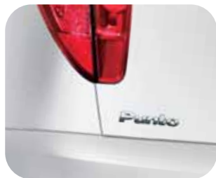
249 Biela Ambient