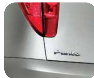
647 Sivá Electro