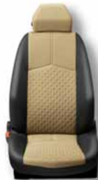
150 Textil béžová