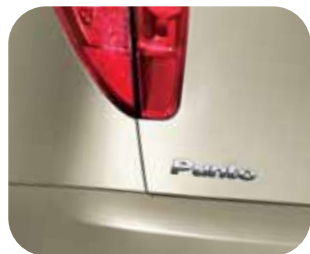
783 Piesková Belly Dance