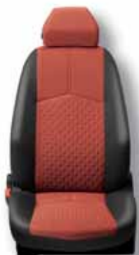
110 Textil červená