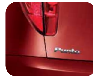
163 Červená Bolero