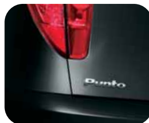
632 Čierna Rockabilly